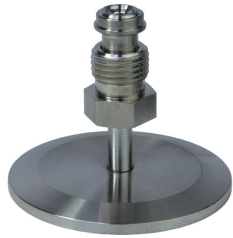
VCR-Adapter, male, G 1/4", DN 40 ISO-KF